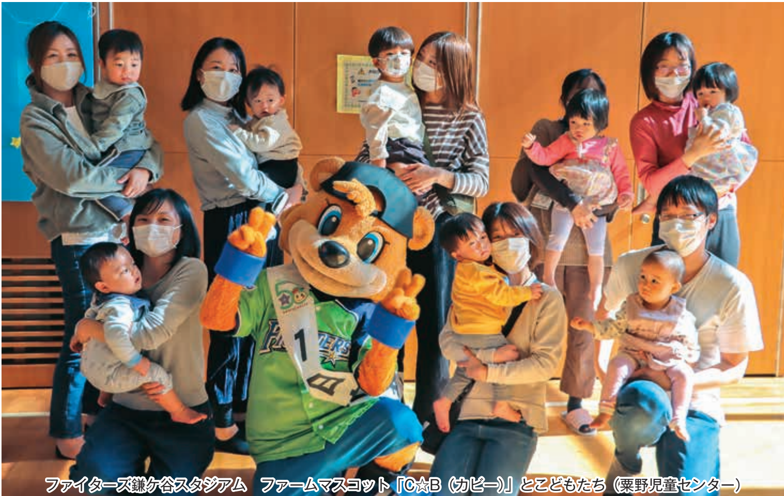
ファイターズ鎌ヶ谷スタジアム ファームマスコット「C☆B (カピー)」と子どもたち (栗野児童センター)

URL https://www.city.kamagaya.chiba.jp/gikai/index.html