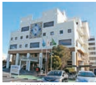
総合福祉保健センター

○ 総合福祉保健センターに分館が整備されると、子育て支援の体制にどのような変化があるのか伺います。 ○ 令和8年度までに運用開始予定の総合福祉保健センター1分館には、子育て関連部署を中心に移転を予定していますが、子育て世代包括支援センターと子ども家庭総合支援拠点をひとつの組織にする「こども家庭センター」の機能も踏まえ、相談窓口や設備等を検討していきます。 ○ こども大綱に示されている「こども計画」や「こどもまんなか社会」の実現に向けた本市の考えを伺います。