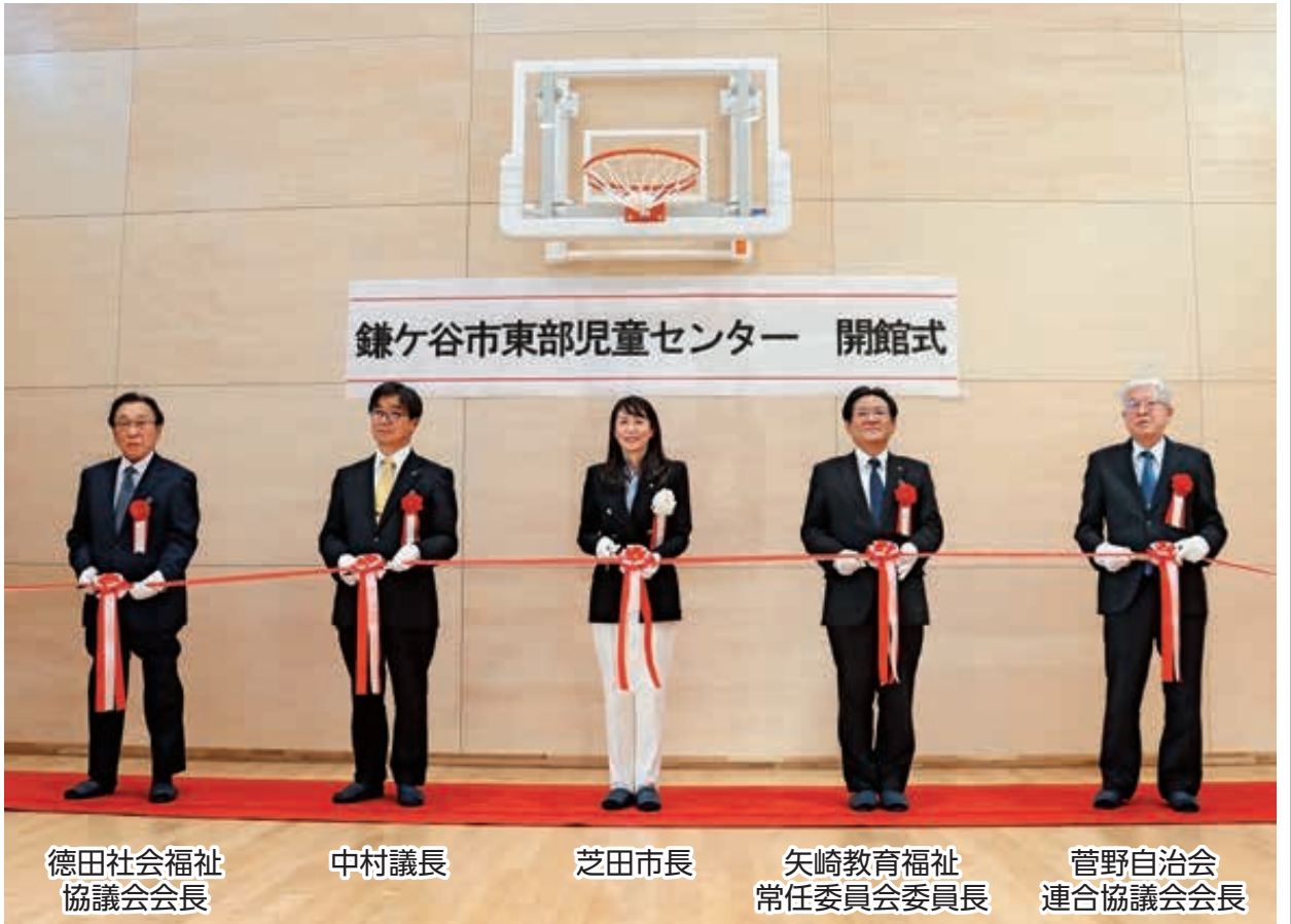
鎌ヶ谷市東部児童センター 開館式