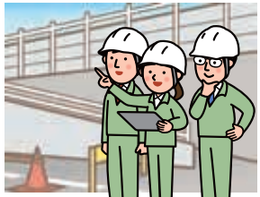
建設現場での作業風景

○ 北千葉道路沿線土地利用整備構想策定に向けて、千葉県や沿線自治体との連携をどのように進めていきますか。 ○ 千葉県では新たな産業、地域づくりに関し、将来の産業の誘致創出を図るため、北千葉道路沿線等の経済を牽引していくことが期待される地域を対象に、産業、地域づくりに関する現状、民間投資に関する分析、民間事業者等の動向把握の調査を実施していきます。市では千葉県の調査結果等を踏まえながら、北千葉道路の今後の事業化を見据え