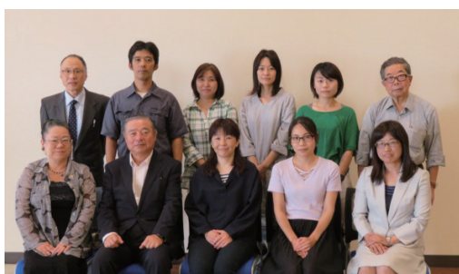
よろしく お願いします