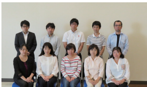
平成30年度 青少年補導員