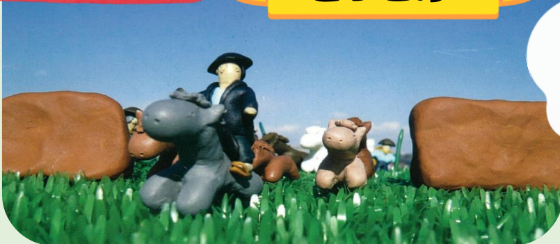
くにしせきしもうさこがねなかのまきあと とっこめ 国史跡下総小金中野牧跡 (捕込)