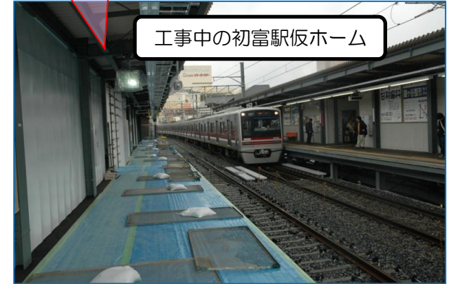
工事中の初富駅仮ホーム