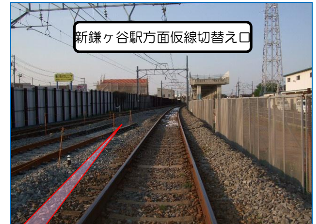
新鎌ヶ谷駅方面仮線切替え口