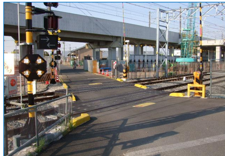
踏切延長が短くなった北初富3号踏切