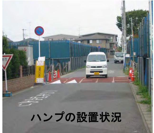
ハンプの設置状況

9月12日～21日に写真の狭さく・ハンプの社会実験をおこないました。 また、同時に行いました社会実験アンケートにご協力いただき、ありがとうございました。