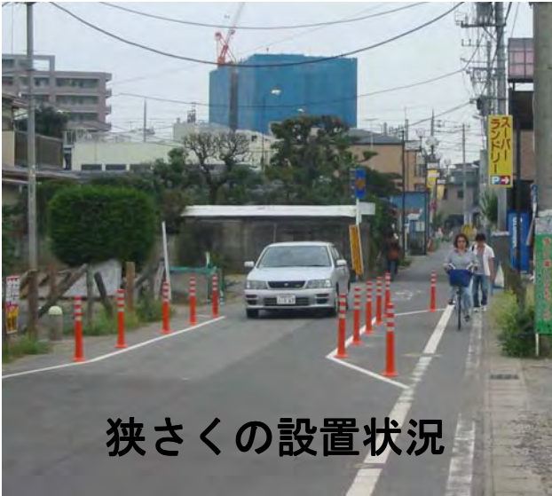
狭さくの設置状況