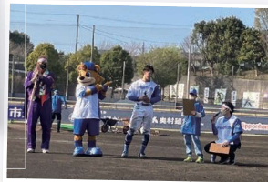
⑤ヒーローインタビュー(毎試合日)