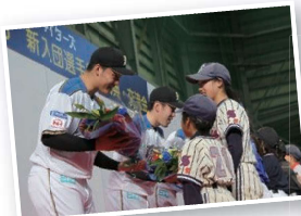
①期待の新人選手が一同に! かまたんも参加。 「ルーキー鎌スタ☆お披露目会」(1月)