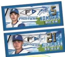
鎌スタ ビジョングラブル