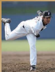
ダルピッシュ有選手 (2005年～2011年)