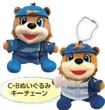
C・Bぬいぐるみ キーチェーン