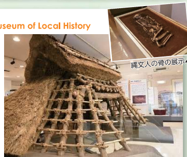
縄文人の骨の展示▶