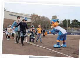
③ベースランニング (土日試合日)

1997年に誕生した、北海道日本ハムファイターズのファーム本拠地、通称:鎌スタ。年間約70試合が開催され、多くの選手が活躍中。 また、年間を通して様々な面白いイベントを開催し、家族みんなで楽しめるボールパークとして人気を集めている。