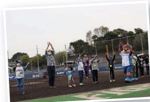
④ラジオ体操(毎試合日)