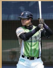
大谷翔平選手 (2013年～2017年)