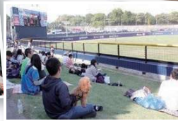
②ワンちゃんも一緒に野球を楽しもう。 『ペット同伴デー』(不定期開催)