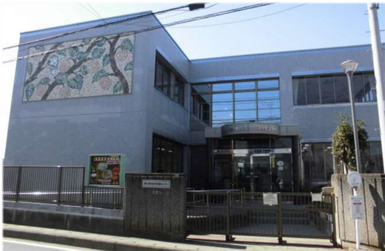
写真：北中沢コミュニティセンター

コミュニティセンターは、市民の自主的な活動の場を確保し、もって市民相互の交流を深め、人間性豊かな地域社会の形成を図るとともに、市民福祉の増進と文化の向上を図るための施設です。