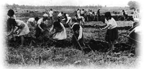
南初富にあった鎌ヶ谷小学校の学級農園での児童の体験学習〈昭和25年(1950)〉