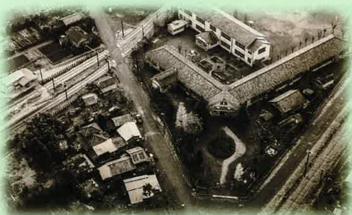
鎌ヶ谷小学校 (空撮・昭和30年(1955)ころ)