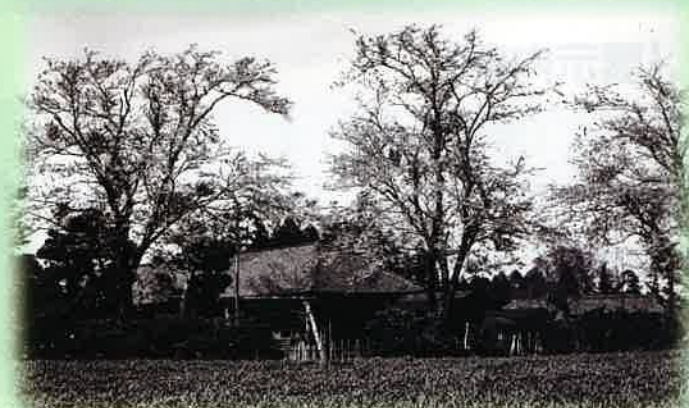
第二分校〔現 南部小学校〕 (昭和30年(1955))