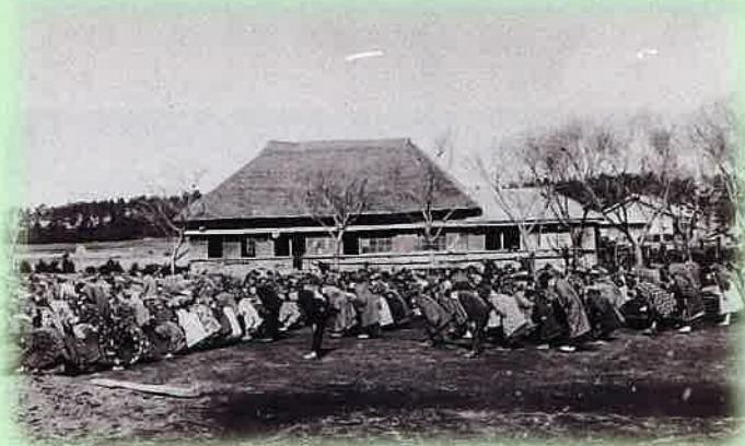
鎌ヶ谷尋常・高等小学校 (大正14年(1925))