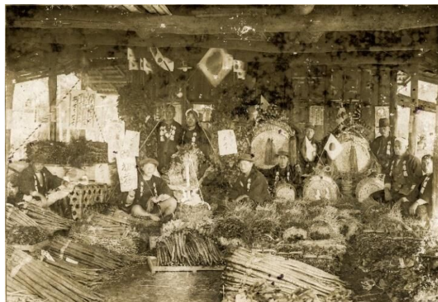
六実青物市場初荷状況(昭和8年)

貴重は明治15年(1882)、佐津間村の澁谷家に生まれました。幕末の草莽の志士で赤報隊幹部の総司の又甥 またおい (総司の兄重右衛門の孫)にあたり、赤報隊の復権運動に尽力したほか、地域の発展のため、生涯にわたって活動を続けました。