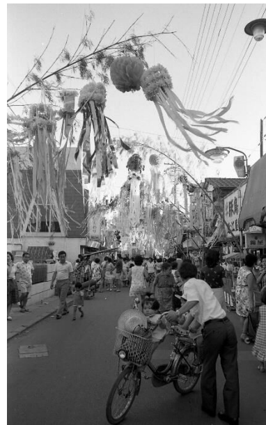
駅前商店街のセタまつり

人口の増大とともに、多種多様な店舗が市内で展開したことを物語る歴史資料を展示します。当時配布された広告チラシなども見られます。