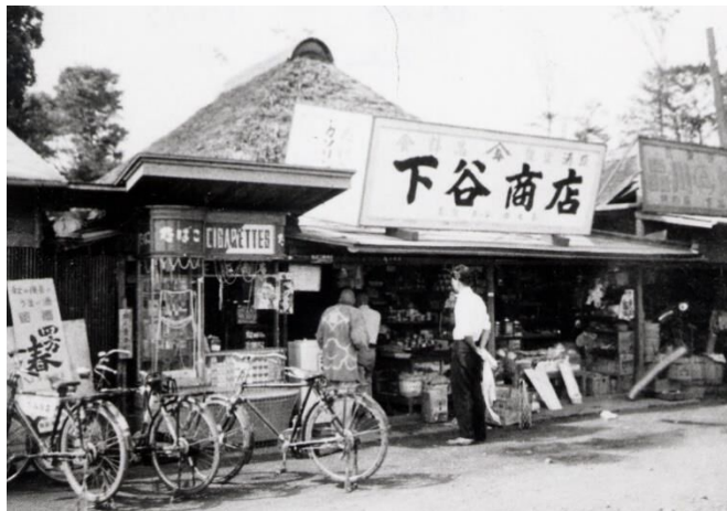
昭和35年頃の下谷商店(初富)

昭和10～20年代の、国策により商業活動が大きく制限されていた時期の歴史資料を展