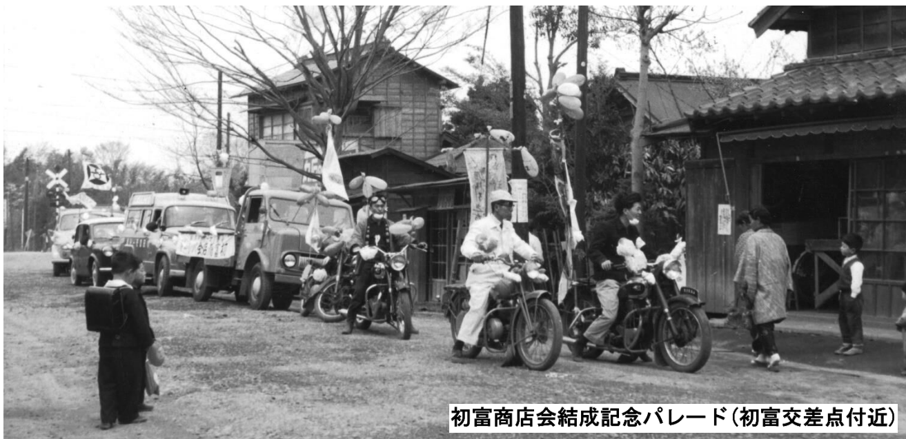
初富商店会結成記念パレード(初富交差点付近)