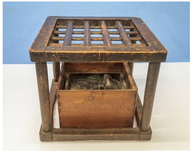
展示している「やぐら炬燵」

炬燵は、ふとんを掛けて手足など部分的に暖を取るもののため、暖房具としては非効率に思えますが、気密性の低い昔の家では暖を