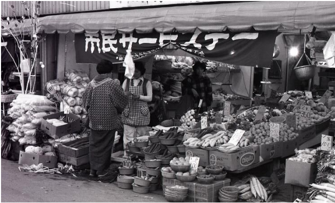
市民サービスデーの八百漬(昭和49年)