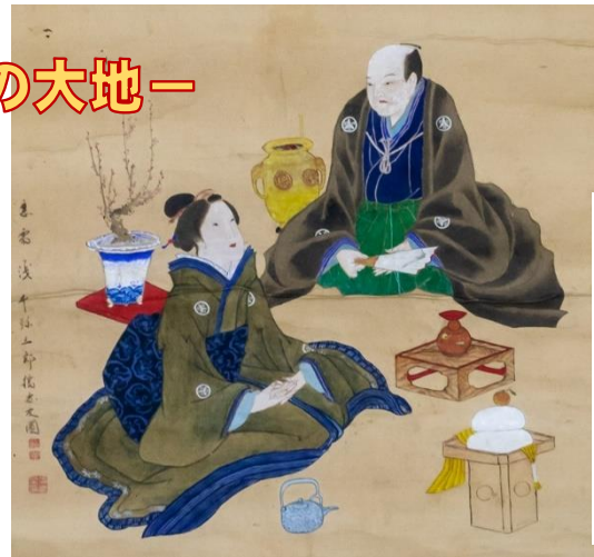
最後の牧士正月の図

②村の人々：牧周辺の村の人々は、毎日、牧の見回りや草木の管理などが義務として課せられていました。ここでは、村の人々とそこから見えてくる野馬と牧の様子について紹介します。