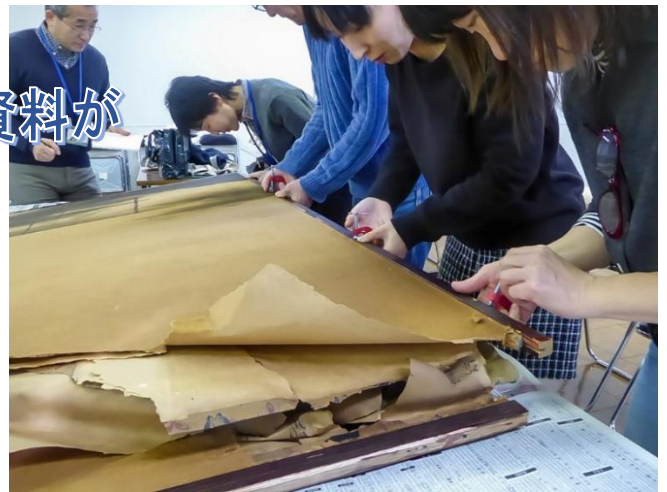
②襖の枠をはずす作業

襖の下にも、地域の歴史が眠っているかもしれません。もし古い襖などの処分を検討している場合は、ぜひ郷土資料館（☎4 4 5 - 1 0 3 0）にご一報ください。