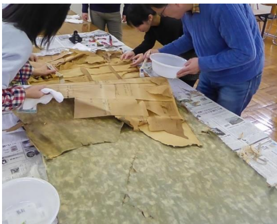
③下張りを剥がす作業

下張りには不用になった古紙を使うことが多く、無造作に裁断されたものもあるので、資料が完全に復元できるわけではありません。しかし、それらの資料が、当時の人々が生活していた証しであることは確かです。