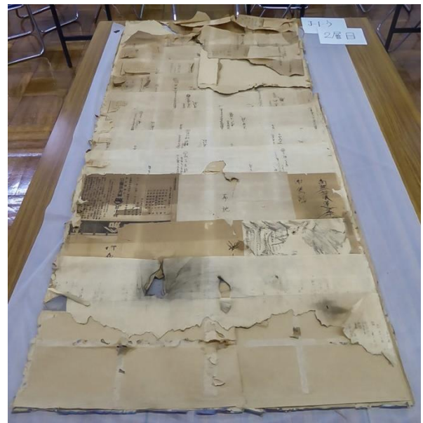
④下張りを剥がした状態

襖の下にも、地域の歴史が眠っているかもしれません。もし古い襖などの処分を検討している場合は、ぜひ郷土資料館（☎4 4 5 - 1 0 3 0）にご一報ください。