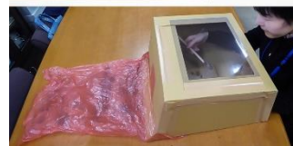
袋を取り付けゴミを集めます

鎌ヶ谷市郷土資料館だより 第50号 令和2年2月15日発行 編集・発行：鎌ヶ谷市郷土資料館