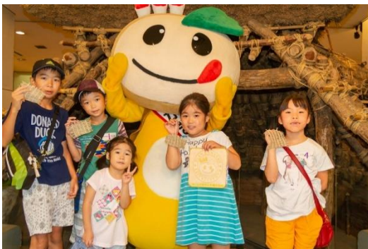
かまたん見て！上手にできたでしょ