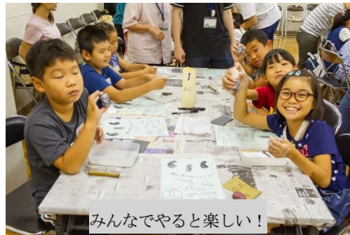
みんなでやると楽しい!