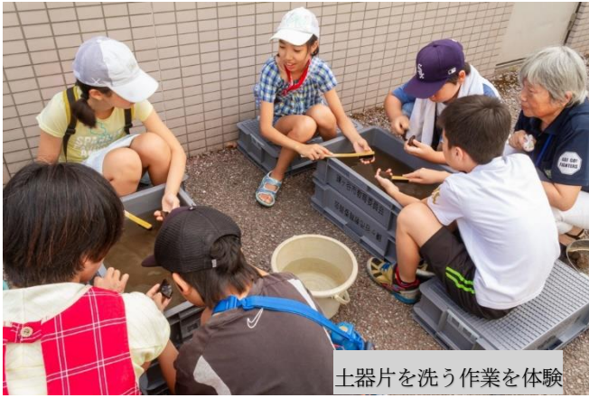
土器片を洗う作業を体験