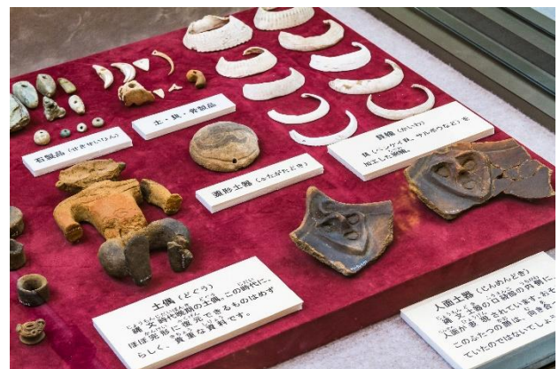
中沢貝塚から出土した「土偶」や「人面土器など」

昔の「ゴミ捨て場」と言われる貝塚ですが、当時の食生活をうかがい知る大切なタイムカプセルです。貝層は、ハマグリやアサリ、イ