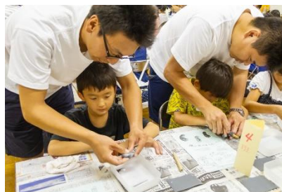
お父さんが熱くなる