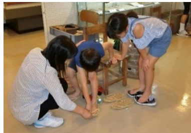
「わらじ」を履いて体験