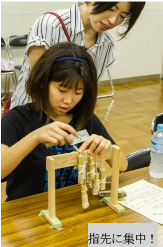
あんぎんコースターづくり(8/25)

イヤ～今年の夏は暑かった！連日の猛暑日は身体に応えました。そんな中、郷土資料館には毎年恒例の夏の講座・教室に大勢の皆さんが参加してくれました。ここでは、各種「夏休み子ども教室」を中心に、写真で資料館の夏を振り返ります。