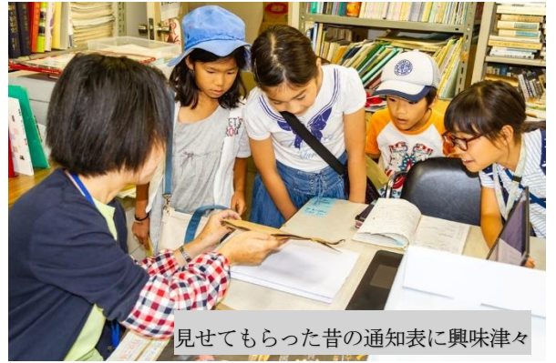
見せてもらった昔の通知表に興味津々