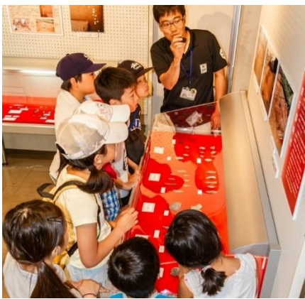
発掘の様子に胸をときめかせる